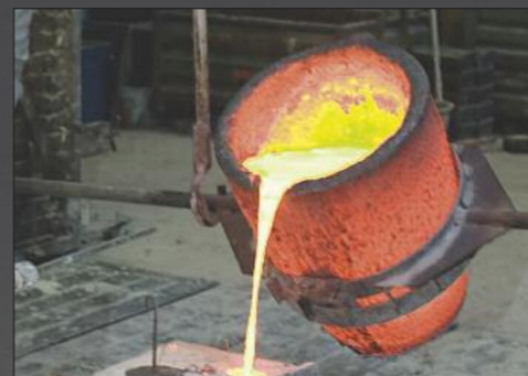
• Demo brongieten door Jos Custers